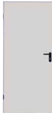
Traffic white (παρόμοιο με το RAL 9016)