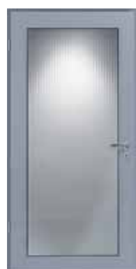
Window grey (παρόμοιο με το RAL 7040)

Η ποικιλία των φινιρισμάτων αποτελεί χαρακτηριστικό γνώρισμα της εσωτερικής πόρτας αλουμινίου AZ 40 από την Hörmann. Διατίθεται ανοδιωμένη ή με επίστρωση πούδρας στα χρώματα RAL αλλά και επιχρωμιωμένη για να περάσετε το χρώμα που επιθυμείτε.