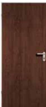
Dark Oak //NEO