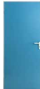
Απαλό μπλε (παρόμοιο με το RAL 5014)