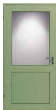
Ξεθωριασμένο πράσινο (παρόμοιο με το RAL 6021)