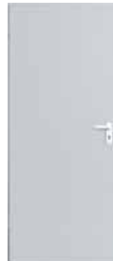
Απαλό γκρι (παρόμοιο με το RAL 7035)