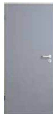
Window Grey (παρόμοιο με το RAL 7040)